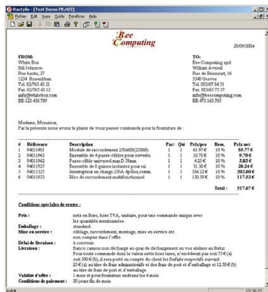
Un bon de commande final